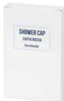
CUFFIA DOCCIA DUSCHHAUBE AQCF