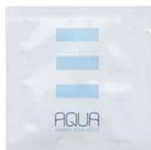
IGIENE INTIMA INTIMPFLEGE 10 ml · AQ10II