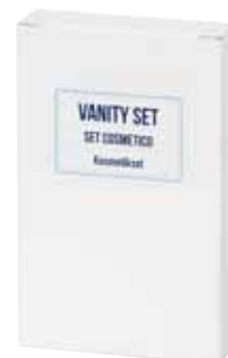
SET COSMETICO KOSMETIKSET AQVS