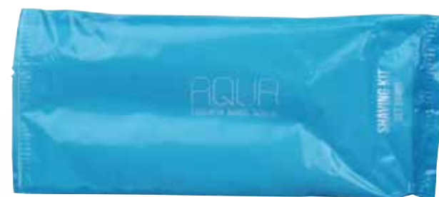
SET BARBA RASIERSET AQSH