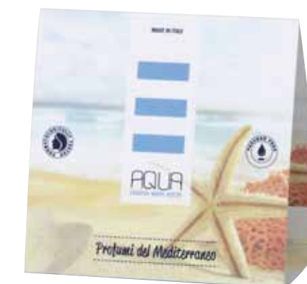
CAVALLOTTO CON PRESENTAZIONE SUL RETRO AUFSTELLER MIT PRÄSENTATION AUF DER RÜCKSEITE AQCAV