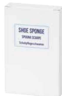
SPUGNA SCARPE SCHUHPFLEGESCHWAMM AQSP