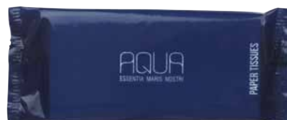
FAZZOLETTI TASCHENTÜCHER AQFZ