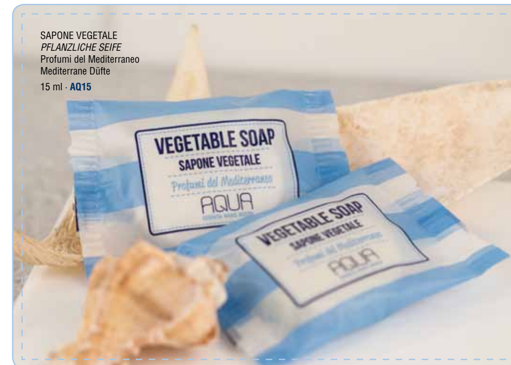
SAPONE VEGETALE PFLANZLICHE SEIFE Profumi del Mediterraneo Mediterrane Düfte 15 ml - AQ15