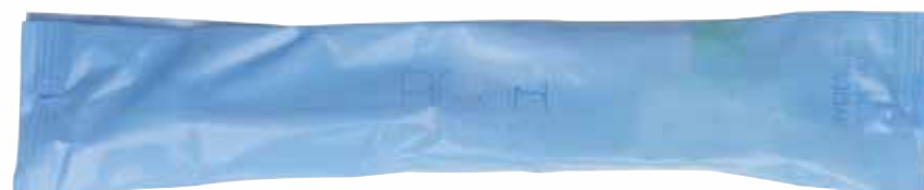
SET IGIENE ORALE MUNDPFLEGESET AQIG