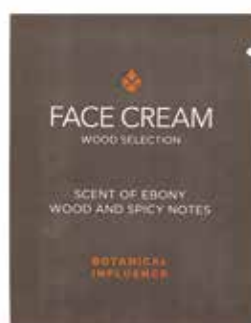
CREMA VISO GESICHTSCREME Legno d'Ebano e spezie Ebenholz und Gewürze 3 ml BT13CV