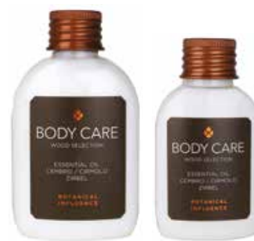
CREMA CORPO KÖRPERCREME Olio essenziale di Cirmolo Äterisches Öl von Zirbel 35 ml BT135BL 60 ml BT160BL