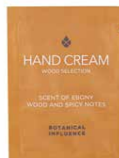
CREMA MANI HANDCREME Legno d'Ebano e spezie Ebenholz und Gewürze 3 ml BT13CM