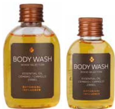
BAGNO DOCCIA DUSCHGEL Olio essenziale di Cirmolo Äterisches Öl von Zirbel 35 ml BT135SG 60 ml BT160SG