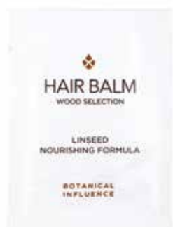
BALSAMO HAARBALSAM Semi di lino Leinsamen 5 ml BT15CO