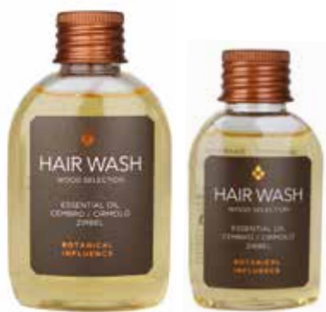
SHAMPOO HAARSHAMPOO Olio essenziale di Cirmolo Äterisches Öl von Zirbel 35 ml BT135SH 60 ml BT160SH