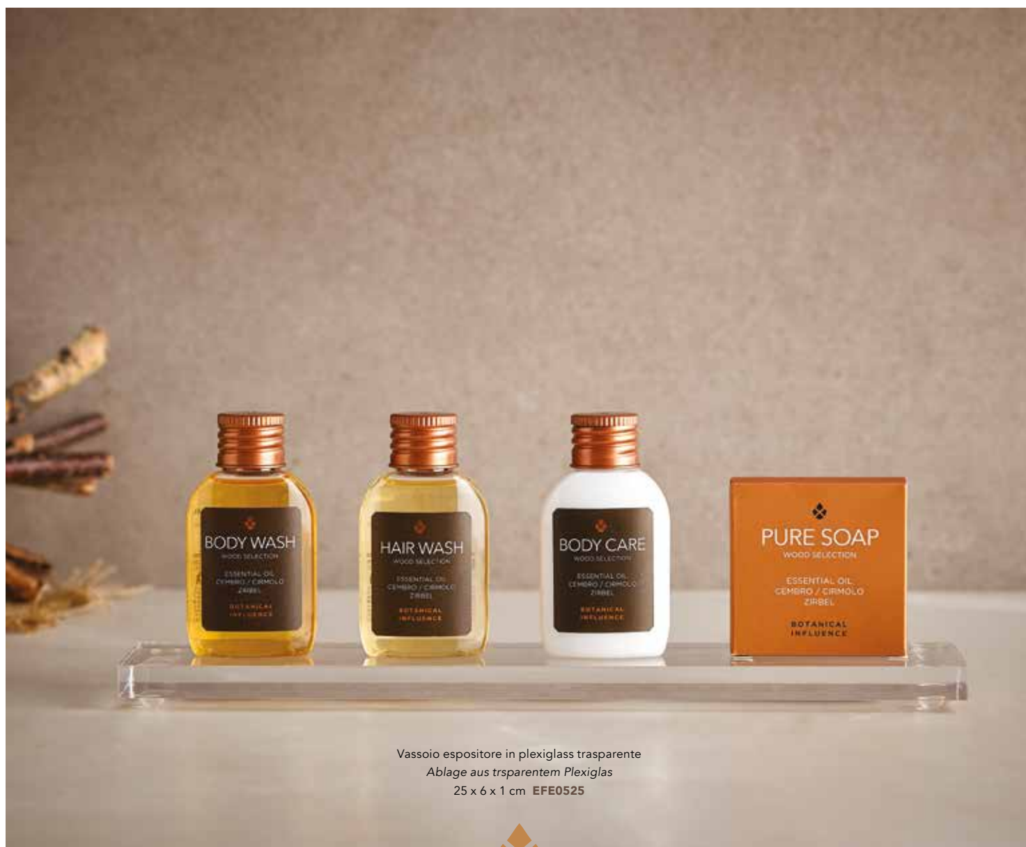
Vassoio espositore in plexiglass trasparente Ablage aus trsparentem Plexiglas 25 x 6 x 1 cm EFE0525