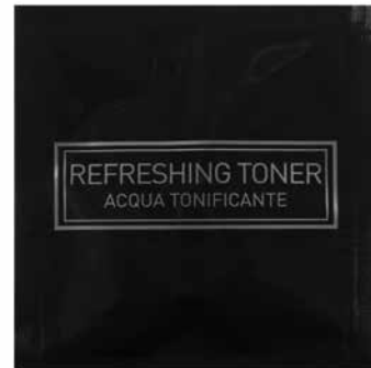
10 ml Acqua Tonicante Gesichtswasser SPA10AT