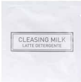
10 ml Latte Detergente Reinigungsmilch SPA10LD