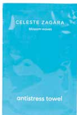
Salvietta Antistress Anti-Stresstuch Lavanda · Lavandel CZSAS