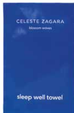
Salvietta Dormi bene Schlafgut Tuch Camomilla · Kamille CZSDB