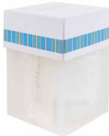
Set Cortesia Kosmetikset CZTR