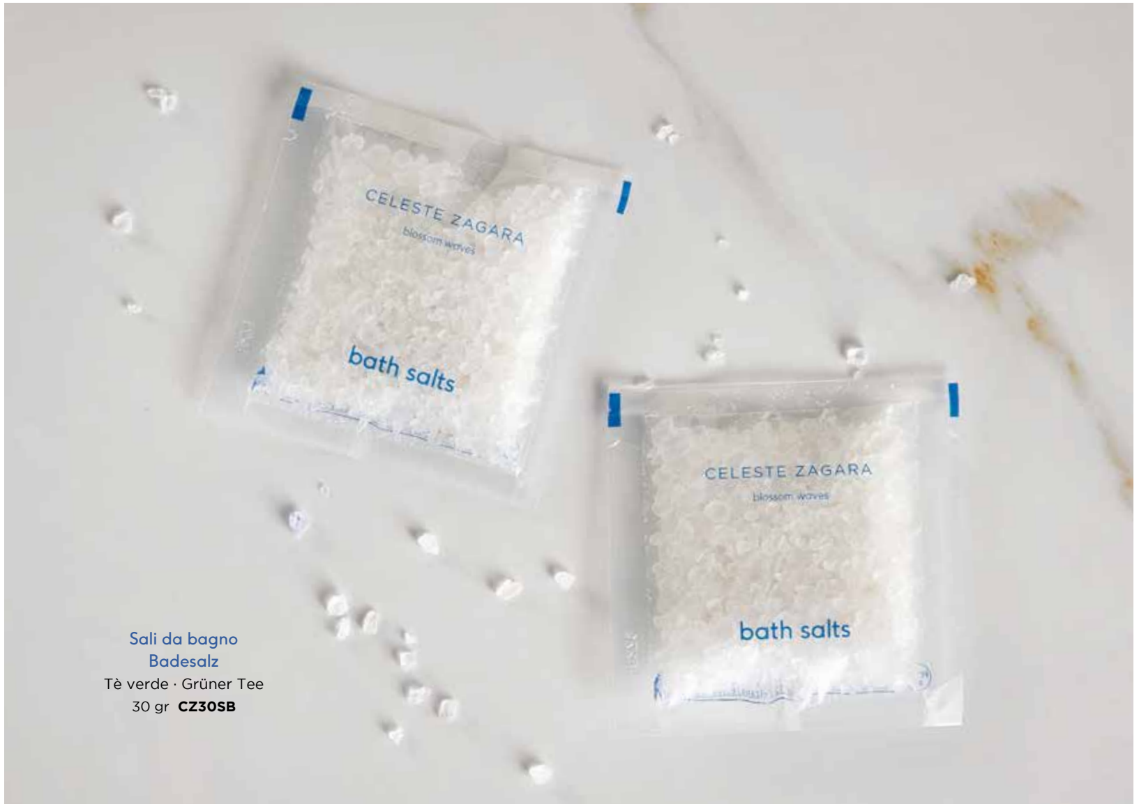
Sali da bagno Badesalz Tè verde · Grüner Tee 30 gr CZ30SB