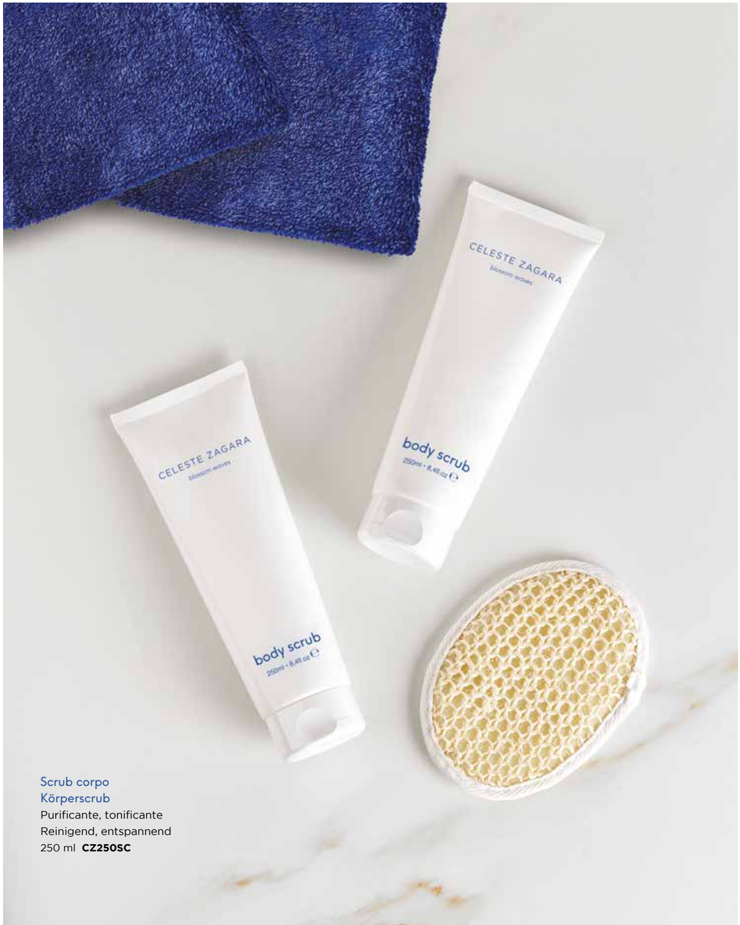
Scrub corpo Körperscrub Purificante, tonificante Reinigend, entspannend 250 ml CZ250SC