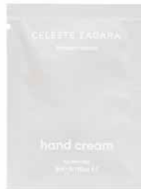
Crema mani Handcreme Ebano e spezie · Ebenholz und Würze 3 ml CZ3CM