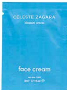
Crema viso Gesichtscreme Ebano e spezie · Ebenholz und Würze 3 ml CZ3CV