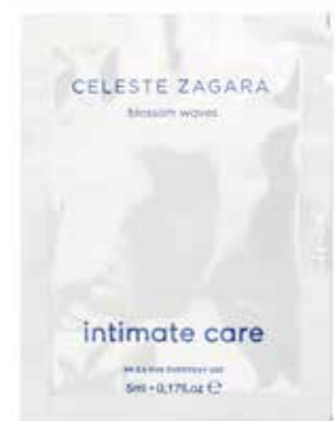
Igiene intima Intimpflege Aloe · Aloe 5 ml CZ5II