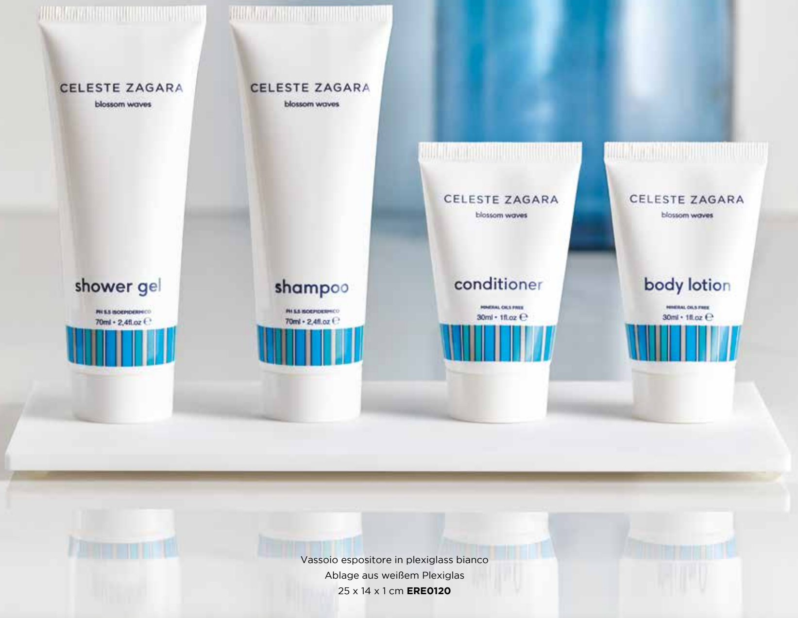
Vassoio espositore in plexiglass bianco Ablage aus weißem Plexiglas 25 x 14 x 1 cm ERE0120

Gel doccia Duschgel 30 ml CZ30SG 70 ml CZ70SG