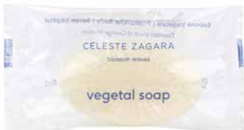
Sapone vegetale Pflanzliche Seife Fiori d'arancio · Orangenblüten 20 gr CZ20