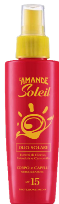
Olio Solare Corpo e Capelli SPF 15 protezione media 125 ml