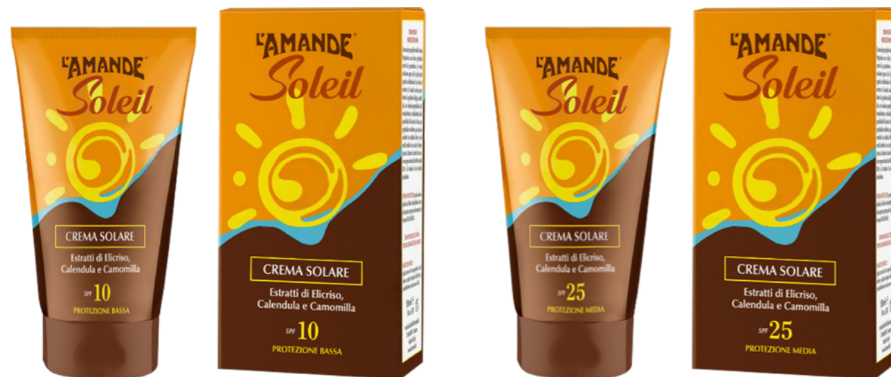
Crema Solare Viso e Corpo SPF 10 protezione bassa 125 ml

Creme solari dalla formulazione innovativa e delicata, con estratti ed oli vegetali, che proteggono attivamente dai raggi solari nutrendo ed idratando la pelle. Ogni pelle sarà protetta al meglio grazie all'associazione di filtri fisici e chimici fotostabili che forniscono la massima protezione dai raggi UVA-UVB e IR. Contiene l'estratto di elicriso da coltivazione biologica, estratti di camomilla e di calendula. Gli oli di mandorle dolci, riso, girasole e argan dalle proprietà nutrienti ed emollienti favoriscono l'azione fotoprotettiva; la vitamina E e l'acido ialuronico svolgono un'azione antiaging e antiossidante. Glicerina vegetale e pantenolo contribuiscono all'idratazione dei tessuti.