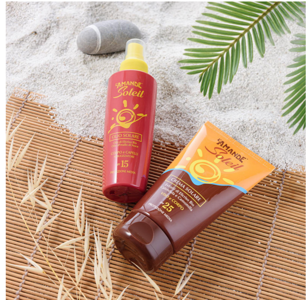
Crema Solare Viso e Corpo SPF 25 protezione media 125 ml

#SENZA GAS PROPELENTE #SENZA ALCOOL #SENZA SILICONI #SENZA OLI MINERALI #SENZA PARABENI #SENZA PEG #SENZA COLORANTI #COMPATIBILITÀ CUTANEA DERMATOLOGICAMENTE TESTATA #PROFUMO PRIVO DI ALLERGENI #7 METALLI TESTATI #CARTONCINO CERTIFICATO FSC