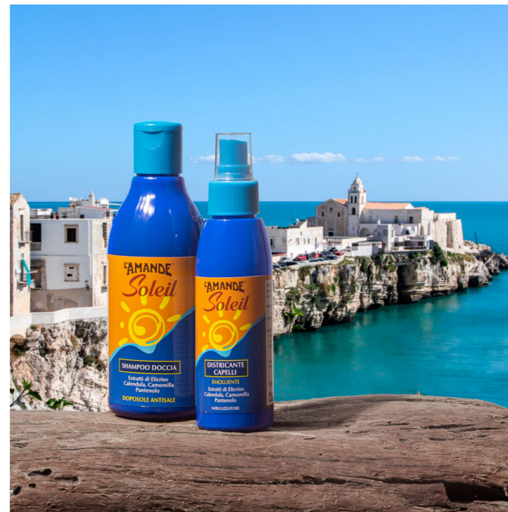
Districante Capelli Emolliente 100 ml

#SENZA GAS PROPELENTE #SENZA ALCOOL #SENZA SILICONI #SENZA OLI MINERALI #SENZA PARABENI #SENZA PEG #SENZA COLORANTI #COMPATIBILITÀ CUTANEA DERMATOLOGICAMENTE TESTATA #PROFUMO PRIVO DI ALLERGENI #7 METALLI TESTATI #PETG 50% RICICLATO E CARTONCINO CERTIFICATO FSC