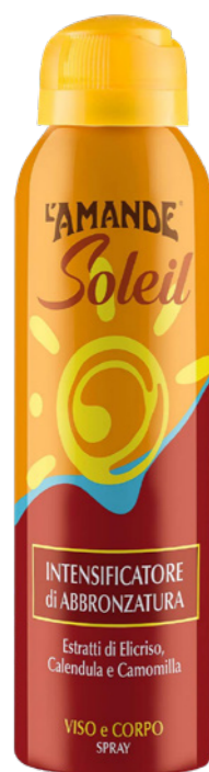
Intensificatore di abbronzatura Viso e Corpo 150 ml

Lo Stick ad alta protezione difende la pelle del viso e le zone delicate come nei, cicatrici, vitiligine, tatuaggi e labbra dalle radiazioni solari. Crea una barriera protettiva riducendo il rischio di scottature ed ustioni con olio di calendula, cere e oli vegetali da coltivazione biologica.