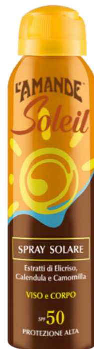
Spray Solare Viso e Corpo SPF 50 protezione alta 150 ml