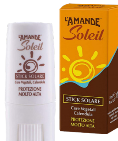
Stick Solare Viso e Corpo SPF 50+ protezione molto alta 9 gr