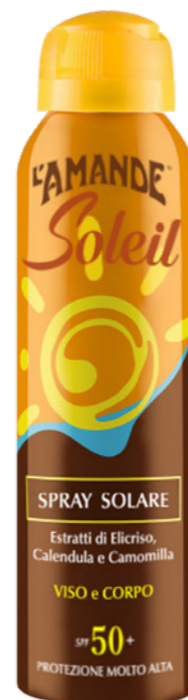
Spray Solare Viso e Corpo SPF 50+ protezione molto alta 150 ml